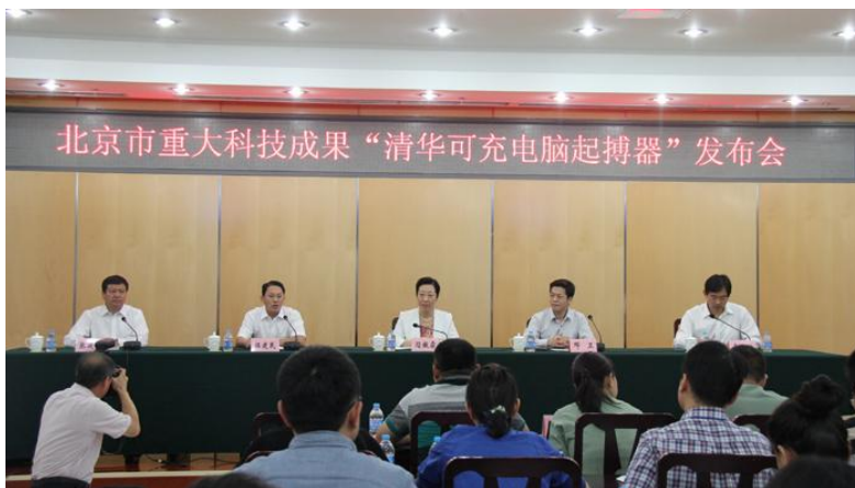
图为“清华可充电脑起搏器”成果发布会现场

当日，北京新闻将“清华可充电脑起搏器”成果发布会作为“建设科技创新中心”系列报道第一集进行报道。清华可充电脑起搏器以“高技术、高附加值、产学研医紧密结合”成为北京市乃至全国高端医疗器械的典型代表，也是北京建设科技创新中心的典型代表。