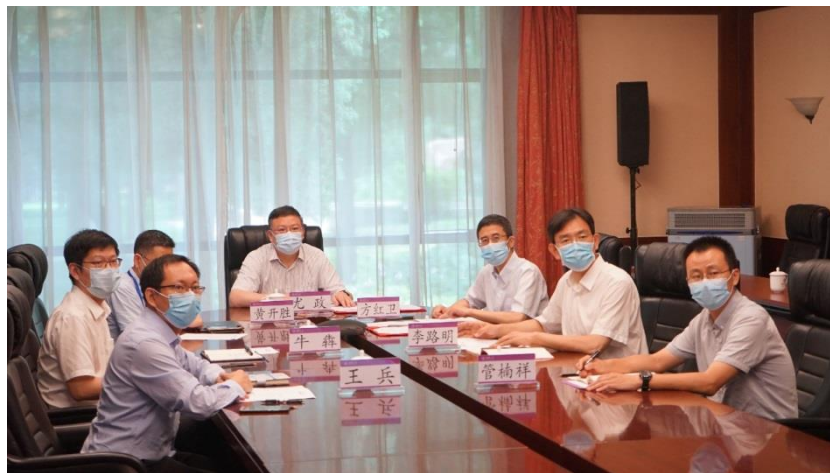
图为 清华会议现场

丁绣峰指出，此次与清华大学等合作，必将成为推动唐山实现高质量发展的重要动力。唐山市委、市政府及有关部门、县区要为合作提供全力支持，努力创造一流的外部环境和条件，明确专人，组建专班，主动对接，及时协调合作中的有关问题，争取让此次合作真正取得实效。