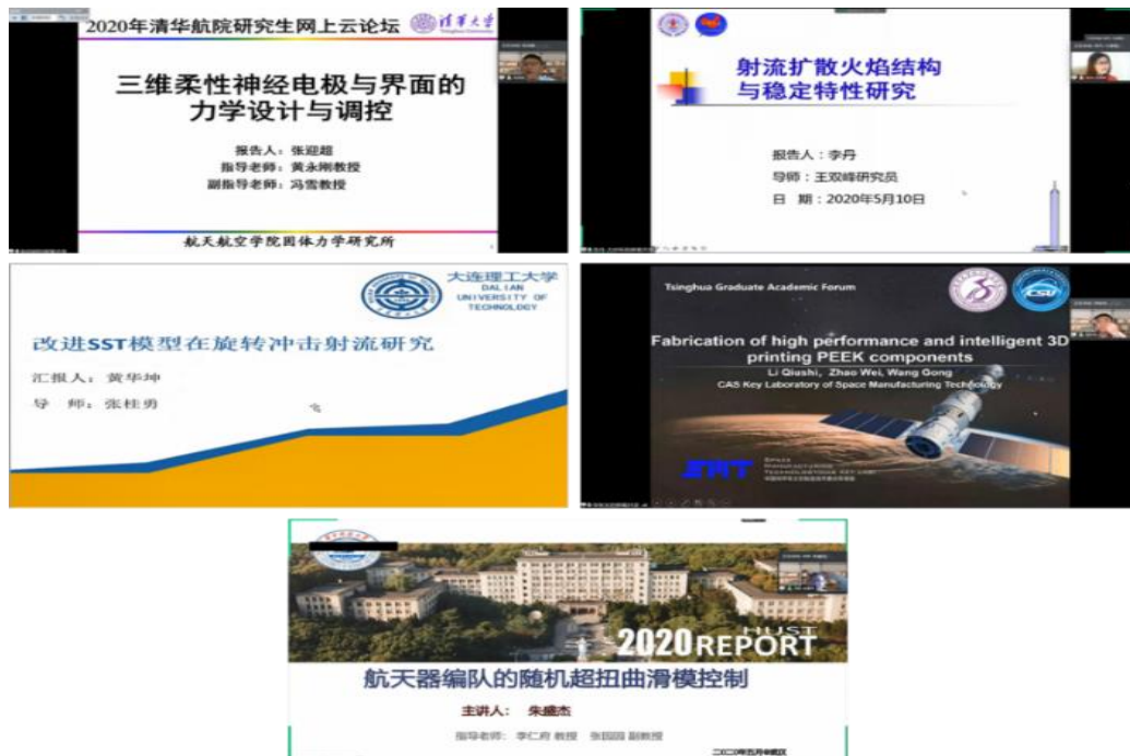
图为 闭幕式特邀报告

10日下午，航院第十八届教育研讨会暨研究生学术论坛闭幕式举行。来自清华大学航天航空学院、中科院力学所、大连理工大学运载工程与力学学部、中科院空间应用工程与技术中心、华中科技大学航空航天学院的5位研究生代表进行了特邀报告，并与现场同学们分享了自己在学术研究中的思考和对科研经历的感悟。