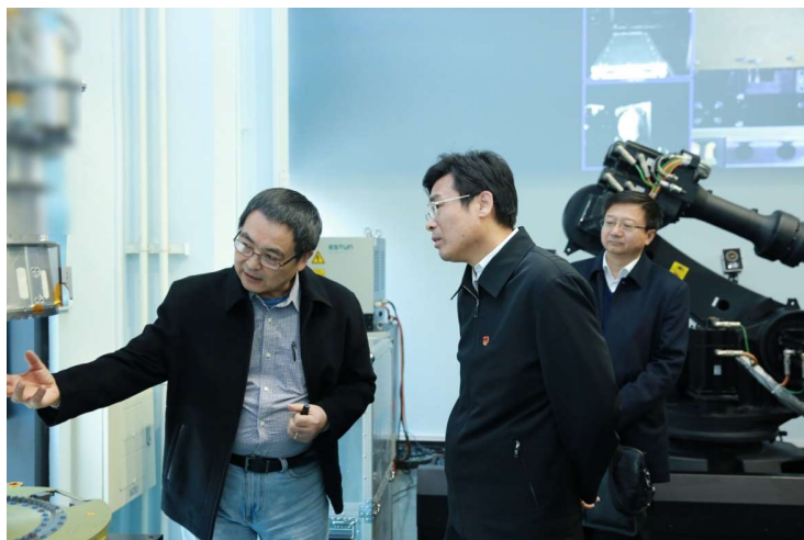
图为 实验室负责人进行相关项目介绍