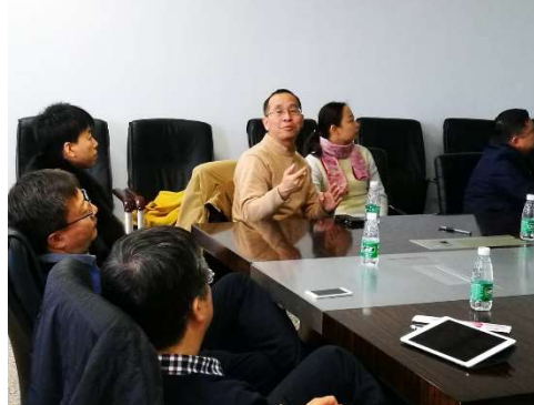
图为 启动会会议现场