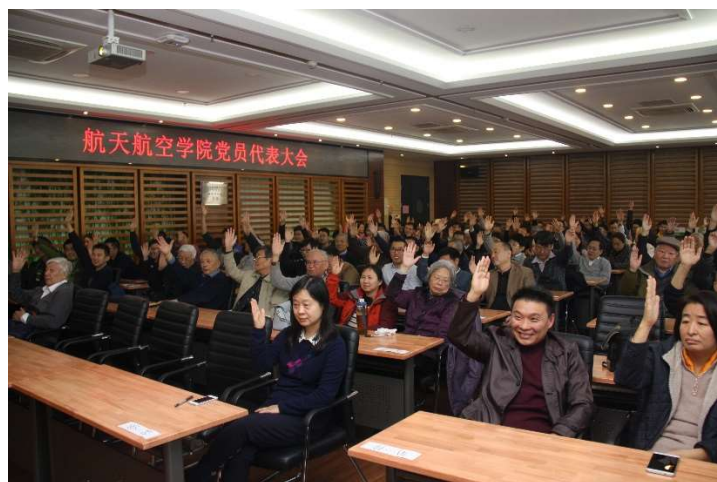
图为 党员代表大会会议现场