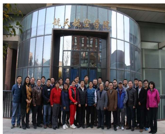
图为 全体参会人员合影