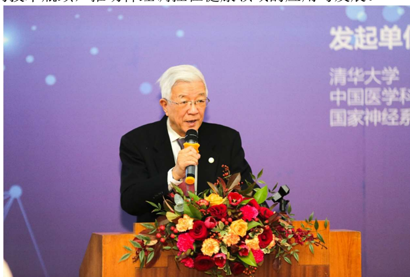
图为 余寿文在仪式上致辞

清华大学原副校长余寿文在致辞中表示，神经调控作为调控脑神经、研究大脑的活动规律的方法，多年来，不仅在技术上取得了重要的成就，而且在临床上也有很好的应用，但同时也面临很多科学和技术问题，需要加大投入，加速研究，联盟的成立应不断促进我国神经调控领域的科学和技术创新，共同突破产业发展的技术瓶颈，推动神经调控在健康领域的应用与发展。