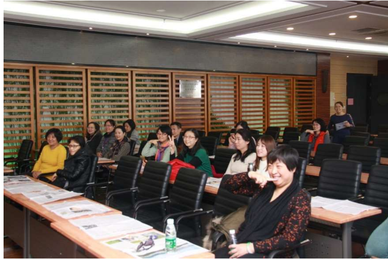
图为 职业礼仪讲座现场

培训师从服装礼仪、仪容礼仪、仪态礼仪等方面进行指导和演示，参会老师积极参与互动，边学边练，学习到了五度微笑、三种坐姿、行姿等职业标准礼仪，以及着装的色彩选择等礼仪。