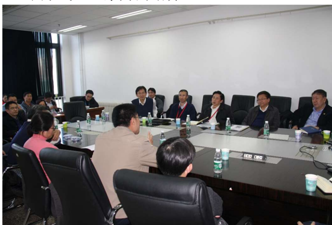
图为 专家组与教师代表交流讨论

专家组对航院的本科教学工作给予肯定并鼓励航院教师从知识点的传授，更多的扩展到对学生思维方式、想象力的培养。