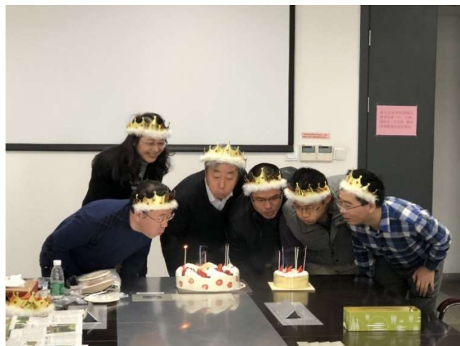
图为 生日会老师集体吹蜡烛

航院工会每年为年龄逢五、逢十的教师举办集体生日会各一次，此活动获得了老师们的认可，活动中的老师们像孩子们一样带上生日帽、点燃生日蜡烛、唱着生日歌，度过了开心、难忘的生日。